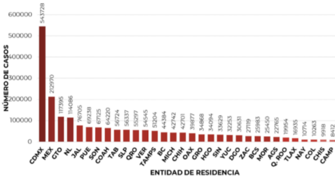
Casos por Estado