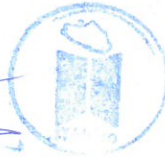
C. Mariana Contreras Soto Comisionada

Instituto de Transparencia, Acceso a la Información y Protección de Datos Personales del Estado de Guerrero