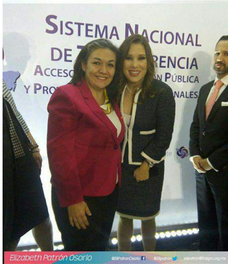
Chilpancingo, Guerrero a 03 de mayo de 2017.- Participación por videoconferencia en la Tercera Sesión Extraordinaria del Consejo Nacional de Transparencia SNT.